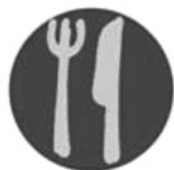
dek die tafel

Om die tafel te dek, dui op die bewustelike keuse om die verhouding met die wat na aan ons is te waardeer en te verdiep deur spesifieke