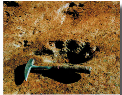
Dicynodont spore en geraamte